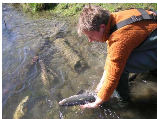
Saumon lâché sur la Pique