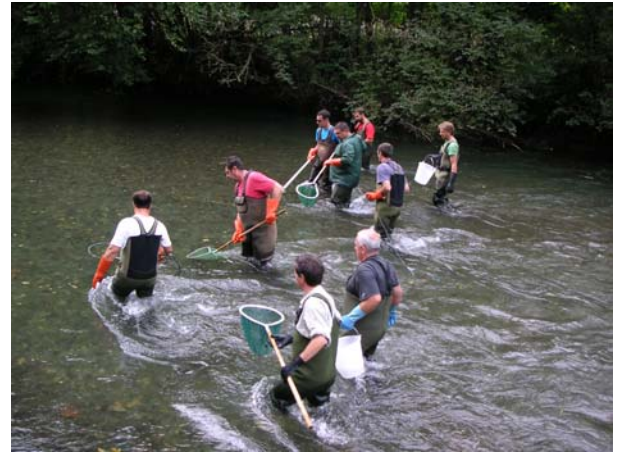
Chantier de pêche du 01-10-09