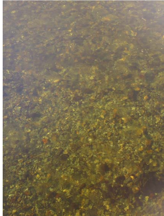
Frayères recensées sur la Pique entre le lac de Badèche et le barrage de Luret