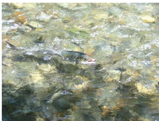
Saumon dans le milieu naturel