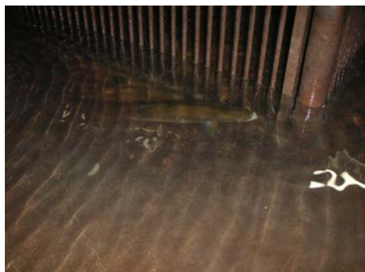
Saumon piégé à Carbonne

En 2008, 42 saumons ont été piégés à Carbonne et transportés sur la Pique (28 femelles et 14 mâles), entre le 19/03/08 et le 24/11/08 :