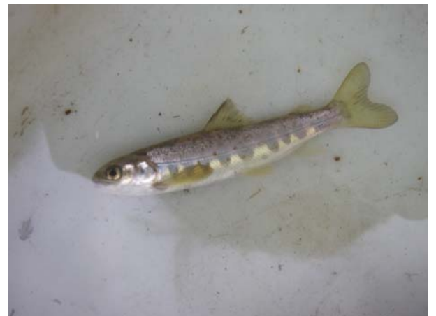
Tacons 0+ capturés