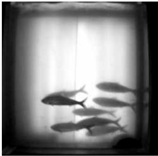
Aloses à la vitre de Golfech le 29-04

Ainsi, 2280 aloses ont été contrôlées entre le 28-04 et le 29-04 dont 1300 entre 13h et 17h le 29-04. (Pour en savoir plus : Bilan Golfech )