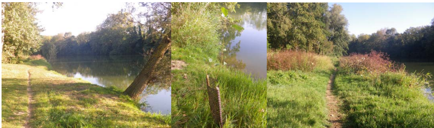
A gauche, une gestion plus classique d'entretien de la végétation ; au centre, un plant de peuplier noir souche 'Garonne' et à droite, la gestion différenciée de la végétation rivulaire

Suite aux travaux réalisés au Bois de Notre Dame, il avait été convenu la mise en place d'une convention sur l'entretien du site entre la Commune d'Auterive et la Communauté de communes de la Vallée de l'Ariège. Cette convention a été signée le 10 octobre 2015, la commune gérant, comme à son habitude, la partie accessible au public avec un entretien classique (tonte, débroussaillage autour des arbres) et la communauté de communes procédant à une gestion différenciée sur le secteur replanté dans le cadre du contrat forestier. Cette gestion a pour objectif de protéger la végétation rivulaire.