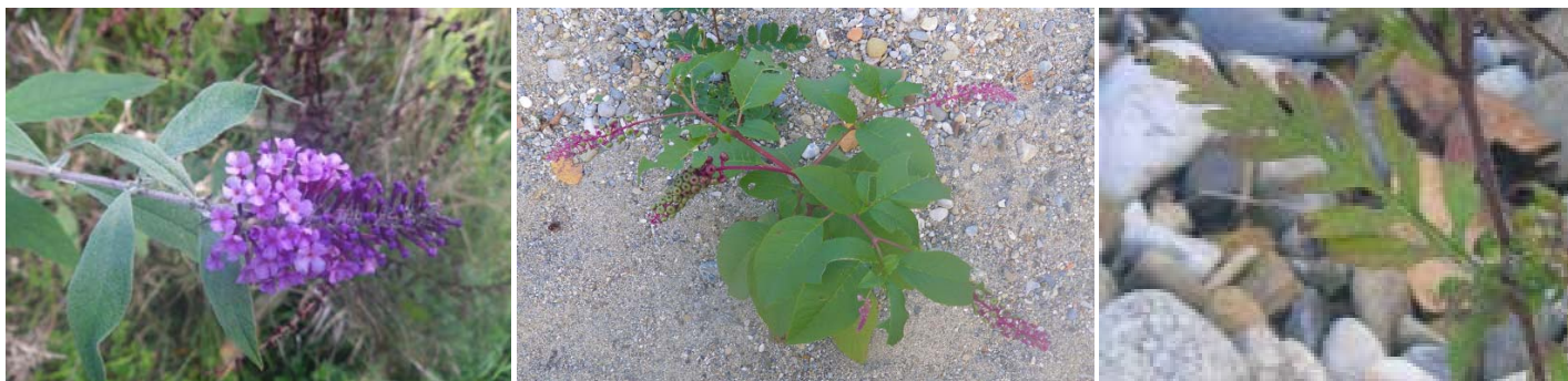
Inflorescence de buddleia, raisin d'Amérique et détail d'une feuille d'ambrosie

A destination des personnels techniques des communes, communautés de communes et syndicats de rivière, cette formation a permis de faire connaître ces espèces et de proposer des stratégies d'action selon les enjeux, les moyens (techniques et financiers) et l'état de colonisation de chaque territoire. Une attention spéciale a été portée à l'ambrosie , espèce nouvellement recensée sur ce cours d'eau et qui peut provoquer des allergies dans la population (6 à 12 % des personnes y sont sensibles : rhume des foins, réactions cutanées...).