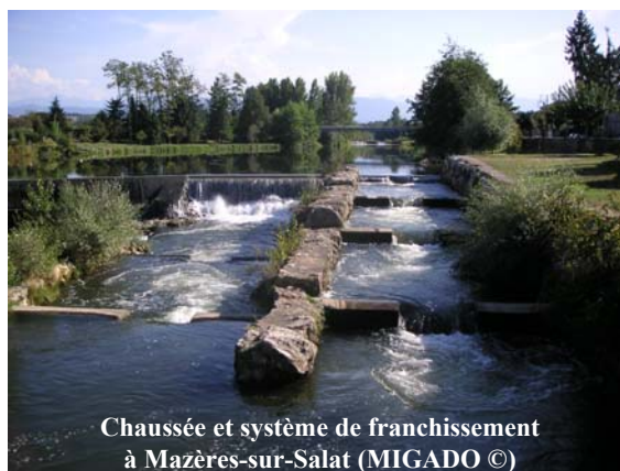
Chaussée et système de franchissement à Mazères-sur-Salat

Le syndicat de rivière du Salat, le SYCOSERP, a organisé une réunion en début d'année 2016 pour décider du devenir de la chaussée du moulin la Suderie, sur la commune de Cassagne, sans usage à l'heure actuelle. Le classement des cours d'eau en liste 2 au titre de l'article L.214-17 du code de l'environnement, dont le Salat fait partie, impose le rétablissement de la libre circulation pour les espèces piscicoles et pour les sédiments.