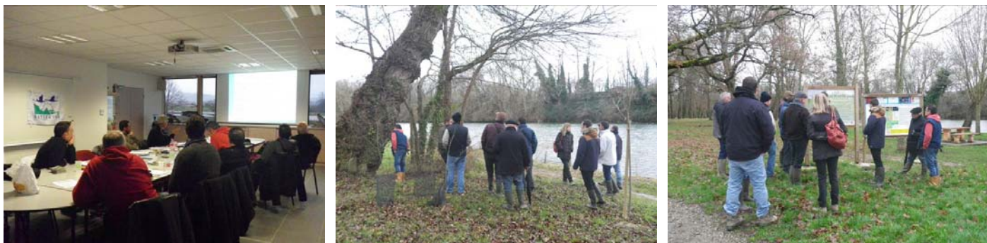
Formation en salle puis visite de terrain au Bois de Notre Dame—Auterive

Les 14 et 15 janvier 2016, une formation était proposée aux responsables des collectivités des 3 entités pour leur présenter la démarche Natura 2000 suivie d'un focus sur les sites concernés, la richesse environnementale du site avec un zoom sur la loutre d'Europe et le saumon Atlantique avec pour terminer les espèces végétales invasives qui menacent la biodiversité. Les enjeux et les menaces des sites Natura 2000 'cours d'eau ariégeois' ont été présentés ainsi que les outils mobilisables (contrats, charte) et le volet animation (mise en place des mesures de gestion). Une visite de terrain a été organisée au Bois de Notre Dame à Auterive pour présenter une réalisation dans le cadre d'un contrat forestier de restauration de la ripisylve.