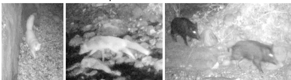
Captures d'images d'observations effectuées par les pièges photos : chat, renard et sangliers au programme !

Des pièges photographiques ont été installés en amont et en aval du barrage de Labarre pour effectuer un suivi de la fréquentation de la loutre dans ce secteur et pour identifier, s'il existait, un lieu de passage privilégié par l'espèce. Les appareils ont été mis en place du mois de décembre 2015 au mois de janvier 2016 et n'ont pas permis d'observer de loutre. Ils doivent être repositionnés durant la saison estivale.