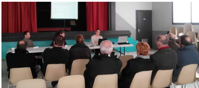
Réunion collective des agriculteurs à Rieucros

La particularité du site Natura 'rivière Hers' est de prendre en compte une partie du lit majeur de la rivière Hers entre Saint-Amadou et Moulin-Neuf ainsi que les 5 km aval du Douctouyre. Sur ce secteur, peuvent être engagées des mesures agro-environnementales et climatiques (MAEC). Il s'agit de mesures agricoles respectueuses de l'environnement qui correspondent à de la création ou à de l'entretien de prairies et à l'utilisation de la lutte biologique contre la pyrale du maïs.