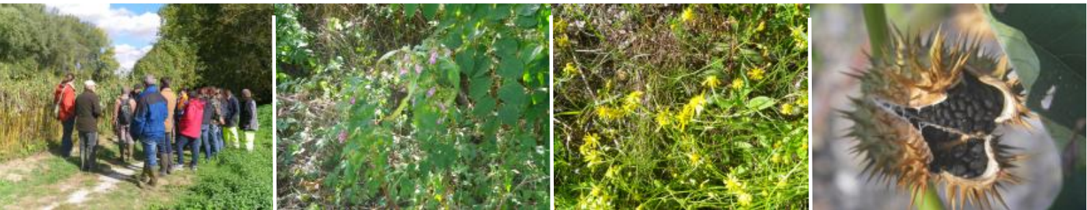
Visite de terrain aux abords de Mirepoix, balsamine de l'Himalaya, séneçon du Cap et fruit du datura

Les 15 et 16 octobre 2015, la cellule animation Natura 2000 organisait en partenariat avec le Conservatoire Botanique National des Pyrénées et de Midi-Pyrénées, une formation Natura 2000 sur les espèces végétales invasives du bord de l'Hers vif, autour de Mirepoix.