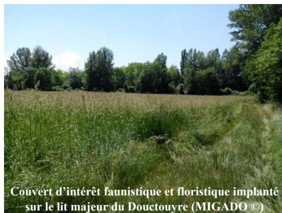
Couvert d'intérêt faunistique et floristique implanté sur le lit majeur du Douctouyre

La lutte biologique sur le maïs consiste à introduire dans les champs des trichogrammes, insectes parasites de la pyrale du maïs. La femelle trichogramme pond dans l'œuf de pyrale et la larve grandit en se nourrissant du contenu de l'œuf, tuant ainsi le ravageur.